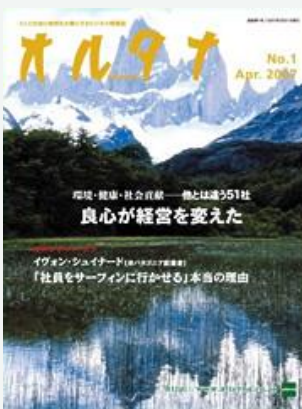
創刊号(2007年4月号) ※販売対象外