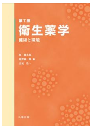
衛生薬学 第7版 丸善出版