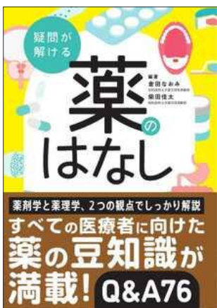
疑問が解ける 薬のはなし 金芳堂