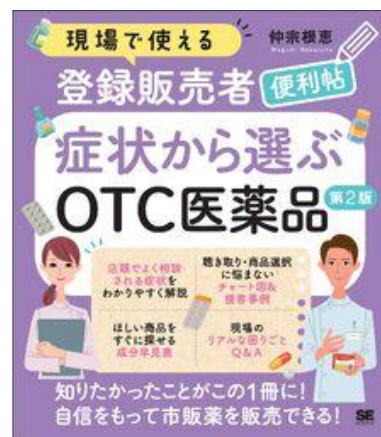
現場で使える 登録販売者便利帖 症状から選ぶOTC医薬品 第2版 翔泳社