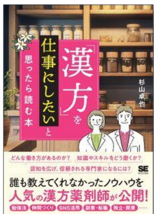
「漢方」を仕事にしたいと思ったら読む本 翔泳社