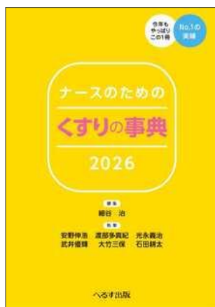
ナースのためのくすりの事典 2026 へるす出版