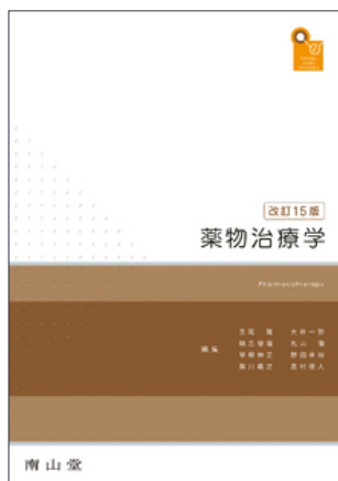
薬物治療学 改訂15版 南山堂