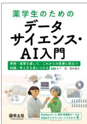
薬学生のためのデータサイエンス・AI入門 羊土社