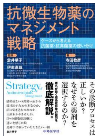
抗不整脈薬の考え方,使い方 中外医学社