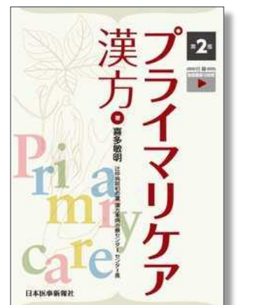
プライマリケア漢方 第2版 日本医事新報社